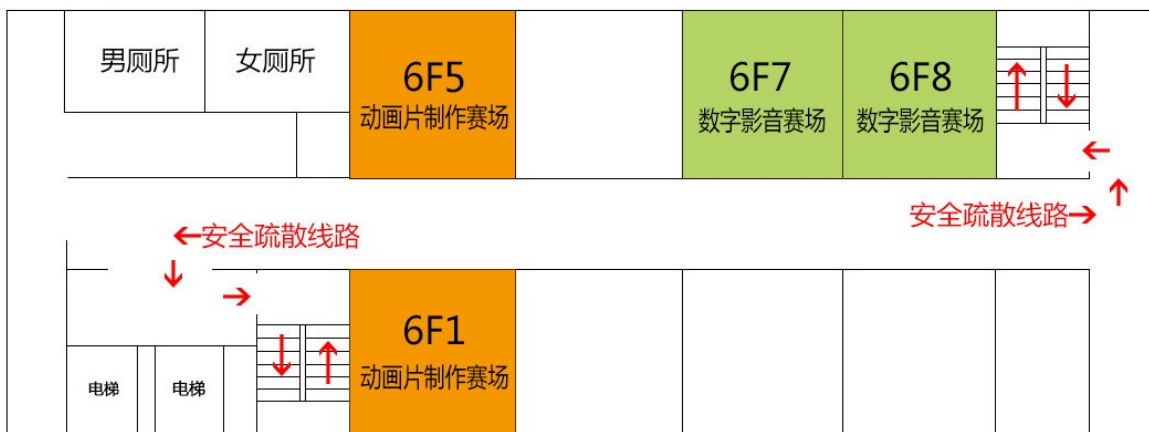
动画片制作 / 数字影音后期制作技术项目竞赛场地 ( 六层 )